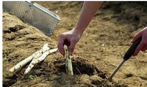
Zülpicher Börde und Vorgebirge: