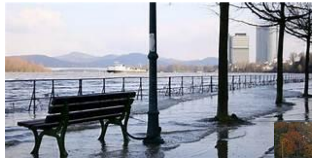
Hochwasser in Bonn