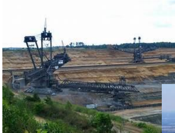
Chemieindustrie in Köln