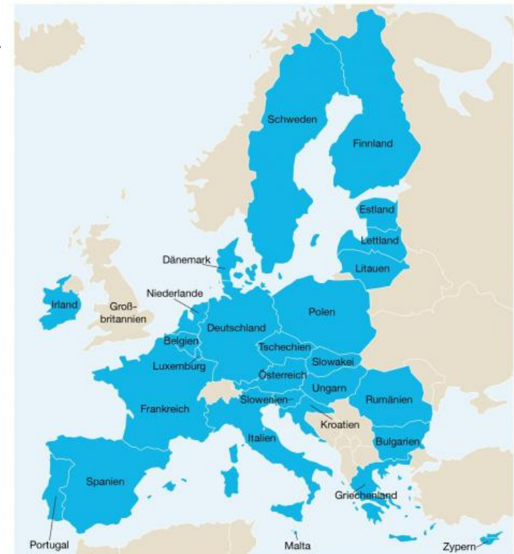
Mitglieder der Europäischen Union

Karte der EU-Mitglieder. Staaten, die Mitglieder der EU sind, sind auf der Karte blau dargestellt.