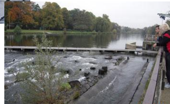
Fischtreppe in der Sieg

Ein Blick auf die Geographie: Rheinabschnitte, Anrainerstaaten